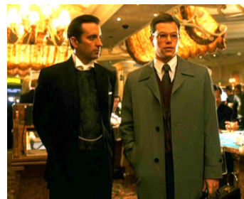
2001 OCEAN'S ELEVEN (Ocean's Eleven) de Steven Soderbergh avec Matt Damon