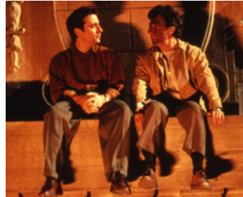
1992 HÉROS MALGRÉ LUI (Accidental Hero) de Stephen Frears avec Dustin Hoffman