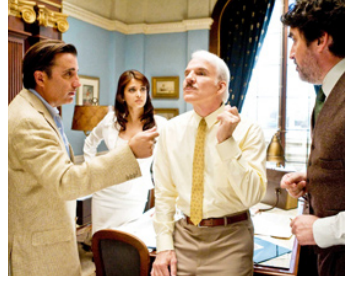
2009 LA PANTHÈRE ROSE 2 (The Pink Panther 2) de H. Zwart avec A. Rai, St. Martin, A. Molina