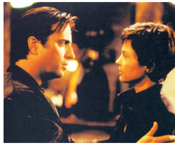
2004 INSTINCTS MEURTRIERS (Twisted) de Philip Kaufman avec Ashley Judd