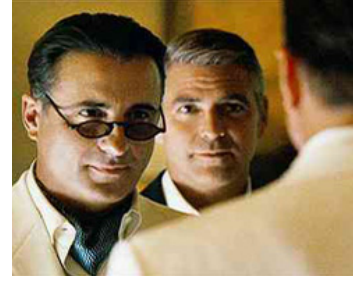
2007 OCEAN'S THIRTEEN (Ocean's Thirteen) de Steven Soderbergh avec George Clooney