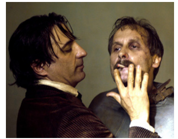
2004 MODIGLIANI (Modigliani) de Mick Davis avec Hippolyte Girardot