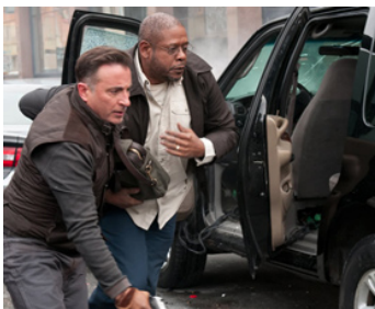
2013 A DARK TRUTH (A Dark Truth) de Damian Lee avec Forest Whitaker