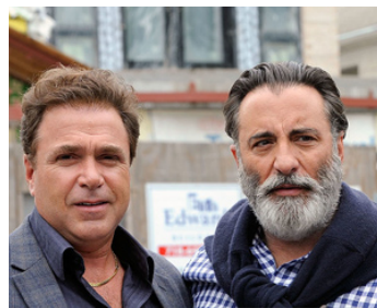
2014 ROB THE MOB (Rob the Mob) de Raymond de Felitta avec Michael Rispoli