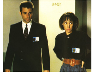
1990 AFFAIRES PRIVÉES (Internal Affairs) de Mike Figgis avec Laurie Metcalf