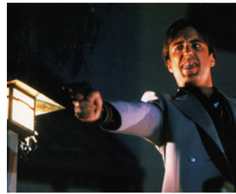
1986 HUIT MILLIONS DE FAÇONS DE MOURIR (8 Million Ways to die) d'Hal Ashby