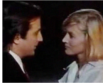
1988 AMERICAN ROULETTE de Maurice Hatton avec Kitty Aldridge