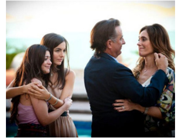
2012 OPEN ROAD (Open Road) de Marcio Garcia avec Ch. Torloni, Camilla Belle, Juliette Lewis