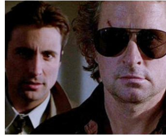
1989 BLACK RAIN (Black Rain) de Ridley Scott avec Michael Douglas