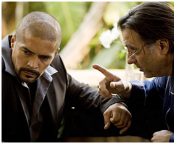
2008 THE LINEA (The Line) de James Cotton avec Kevin Gage