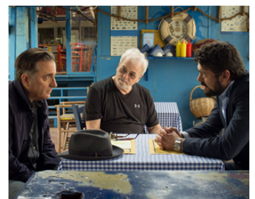
2018 AGENTS DOUBLES (Bent) de Robert Moresco avec Jay Natelle, Karl Urban