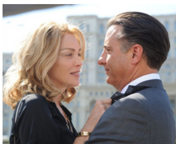
2015 WHAT ABOUT LOVE de Klaus Menzel avec Sharon Stone