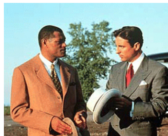
1997 LES SEIGNEURS DE HARLEM (Hoodlum) de Bill Duke avec Lawrence Fishburne