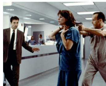
1998 L'ENJEU (Desperate Measures) de Barbet Schroeder avec M.Keaton, Marcia Gay Harden