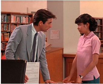
1988 ENVERS ET CONTRE TOUS (Stand and deliver) de R. Menendez avec Vanessa Marquez