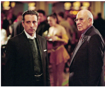
2004 OCEAN'S TWELVE (Ocean's Twelve) de Steven Soderbergh avec Frank Langella