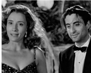
1991 DEAD AGAIN (Dead Again) de Kenneth Branagh avec Emma Thompson