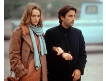
1992 JENNIFER 8 (Jennifer Eight) de Bruce Robinson avec Uma Thurman