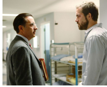
2007 MISE À PRIX (Smokin' Aces) de Joe Carnahan avec Ryan Reynolds