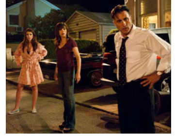
2010 CITY ISLAND (City Island) de R. de Felitta avec Juliana Margulies, Dominik Garcia Lorido