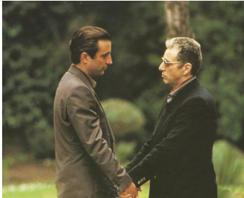
1990 LE PARRAIN 3 (The Godfather part 3) de Francis Ford Coppola avec Al Pacino