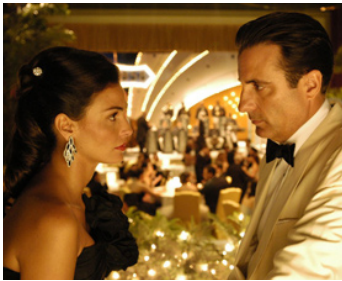
2005 ADIEU CUBA (The lost City) d'Andy Garcia avec Ines Sastre