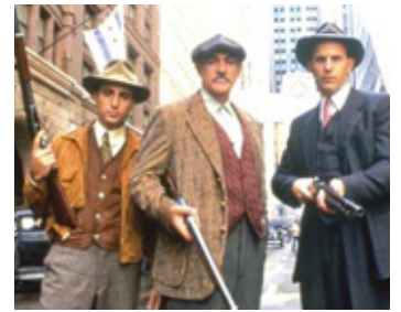
1987 LES INCORRUPTIBLES (The Untouchables) de B. De Palma avec S. Connery, K. Costner