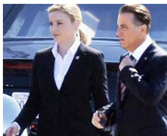
2015 GEOSTORM (Geostorm) de Dean Devlin avec Abbie Cornish