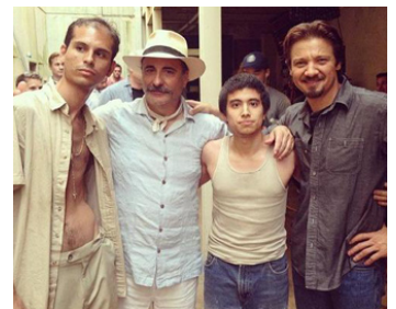
2014 SECRET D'ÉTAT (Kill the Messenger) de M. Cuesta avec Joshua Close, Jeremy Renner