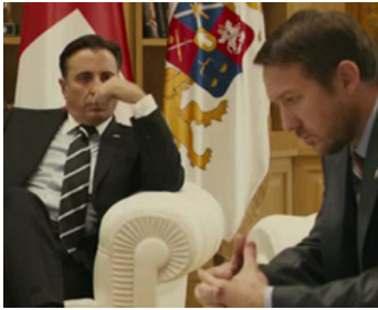
2010 ÉTATS DE GUERRE (Five Days of August) de Renny Harlin avec Sherdo Shvedkov