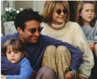
1994 POUR L'AMOUR D'UNE FEMME (When a Man loves a Woman) de L. Mandoki avec Meg Ryan