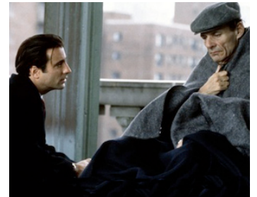
1997 DANS L'OMBRE DE MANHATTAN (Night Falls on Manhattan) de S. Lumet avec Ron Liebman