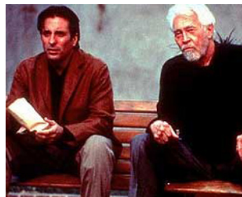
2001 L'HOMME D'ELYSIAN FIELDS (The Man from Elysian Fields) de G. Hickenlooper avec J. Coburn