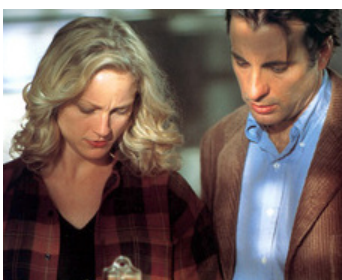
2001 SOUS LE SILENCE (The Unsaid) de Tom McLoughlin avec Teri Polo