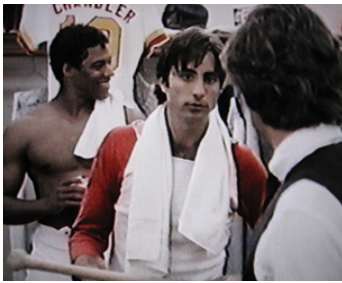
1983 BLUE SKIES AGAIN de Richard Michaels