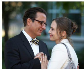
2013 MIDDLETON (At Middleton) d'Adam Rogers avec Vera Farmiga