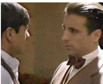
1997 THE DISAPPEARANCE OF GARCIA LORCA de Marcos Zurinaga avec Naim Thomas