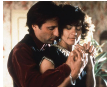
1995 FAUX FRÈRES, VRAIS JUMEAUX (Steal Big Steal Little) d'A. Davis avec Rachel Ticotin