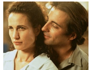
1999 GARCIA ET LINDA (Just the Ticket) de Richard Wenk avec Andie MacDowell