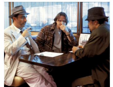
2003 CONFIDENCE (Confidence) de James Foley avec Donal Logue, Luiz Guzman