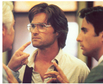
1985 UN ÉTÉ POURRI (The Mean Season) de Phillip Borsos avec Kurt Russell